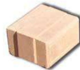
Bloc 100/100 autobloquant