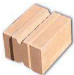
Bloc à conduite